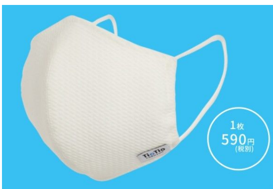
TioTioプレミアム 洗える立体マスク

青山商事の「TioTioプレミアム 洗える立体マスク」は、ハイブリッド触媒®TioTio® PREMIUMという特殊な加工を行うことで、清潔で安全に保つ機能を持たせた布地を使用していることが特徴。抗ウイルス性、抗菌、消臭、防汚、安全性、抗カビなどに長けており、現在は抽選販売が行われるほど人気を集めている。